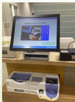
自動精算機ClinicKIOSK for Desktop